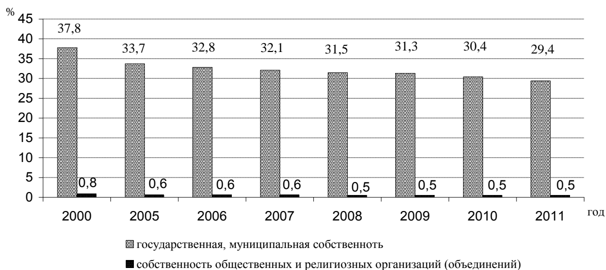
Рисунок 2. Динамика удельного веса занятых в общественных, религиозных, государственных и муниципальных организациях от общего числа занятых в экономике РФ,

В настоящее время доля занятых в некоммерческом секторе экономике оценивается только по числу занятых в общественных и религиозных организациях. Но нельзя забывать о том, что часть НКО находится в государственной и муниципальной собственности, поэтому на наш взгляд является целесообразным сравнить долю занятых в данных организациях.