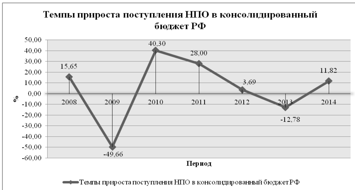
Рисунок 2 – Динамика темпов прироста поступления НПО в консолидированный бюджет РФ за 2008-2014 гг.

Рассматривая структуру поступлений по данному налогу в разрезе видов экономической деятельности за 2014 год, можно отметить, что наибольшую долю занимают поступления от оптовой и розничной торговли, включая ремонт автотранспортных средств, мотоциклов, бытовых изделий и предметов личного пользования – 23,45%, от добычи полезных ископаемых – 17,62%, от обрабатывающих производств – 15,71% (рисунок 3). Таким образом, только от этих видов деятельности в бюджет поступает более половины совокупной суммы налоговых платежей по налогу на прибыль организаций. При этом, несмотря на снижение курса нефти в 2015 году, благодаря параллельному росту обменного курса рубля можно предположить, что по итогам года рассматриваемые налоговые поступления по добыче полезных ископаемых останутся на уровне не ниже 2014 года.