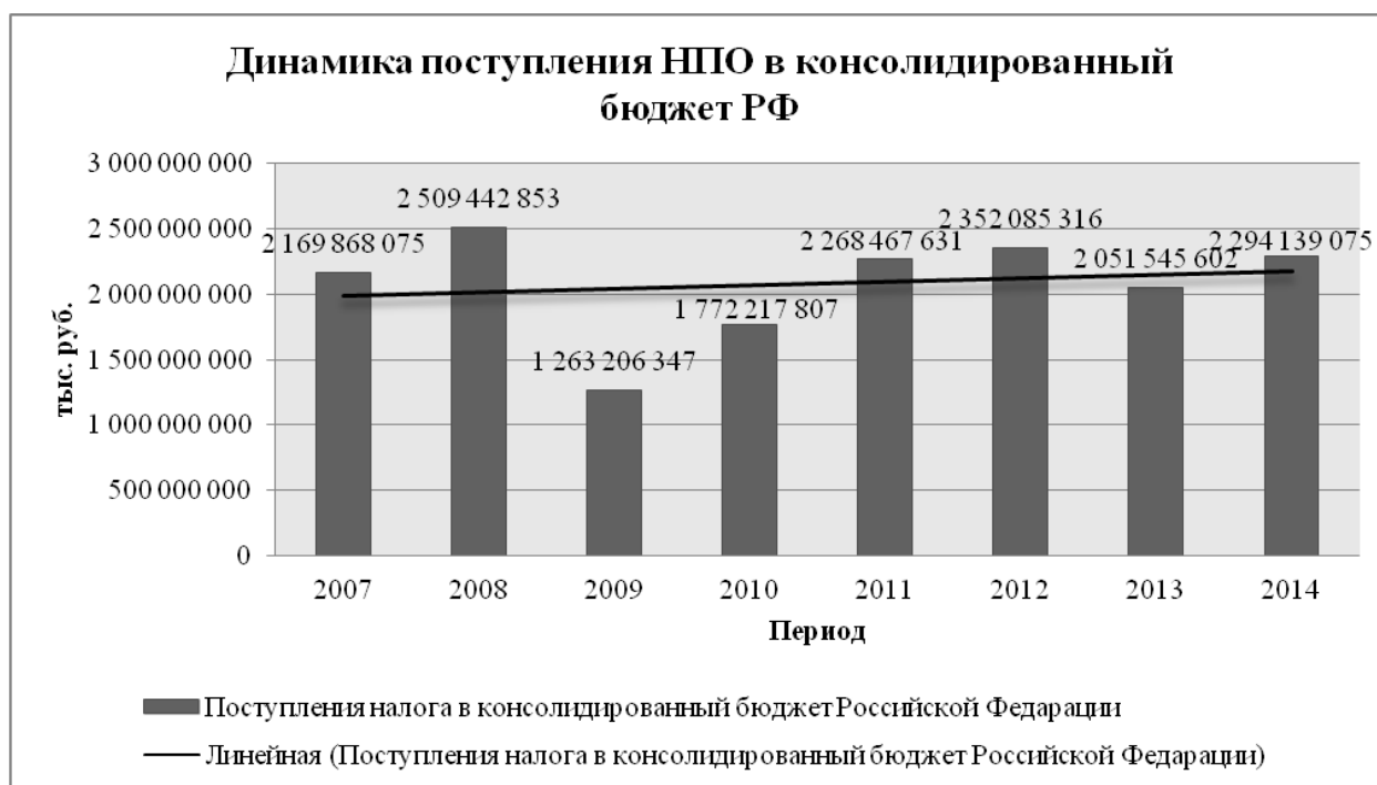
Рисунок 1 – Динамика поступления НПО в консолидированный бюджет РФ за 2007-2014 гг.

В целом данная антикризисная мера положительно сказалась на восстановлении экономики через облегчение налогового бремени организаций. При уменьшенной ставке налога в 2014 поступления в бюджет по размеру почти достигли докризисного периода (рисунок 1).