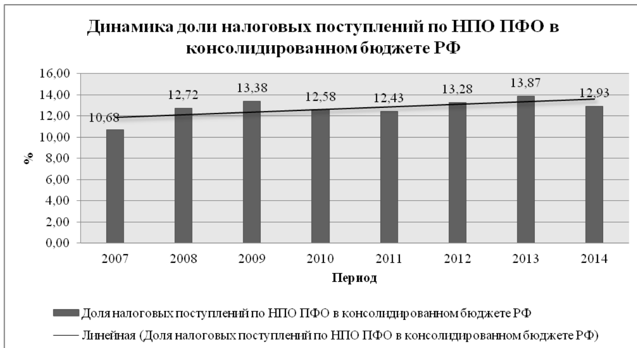
Рисунок 4 – Динамика доли налоговых поступлений налога на прибыль организаций ПФО в консолидированном бюджете РФ за 2007-2014 гг.

Республика Мордовия входит в состав Приволжского федерального округа наравне с другими тринадцатью субъектами, среди которых для проводимого сравнения интерес представляют соседние, а именно: Чувашская Республика, Нижегородская область, Пензенская область, Самарская область, Ульяновская область.