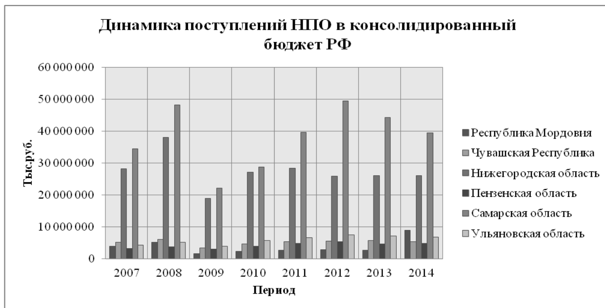
Рисунок 5 – Динамика поступлений налога на прибыль организаций в консолидированном бюджете РФ за 2007-2014 гг.

Республика Мордовия входит в состав Приволжского федерального округа наравне с другими тринадцатью субъектами, среди которых для проводимого сравнения интерес представляют соседние, а именно: Чувашская Республика, Нижегородская область, Пензенская область, Самарская область, Ульяновская область.