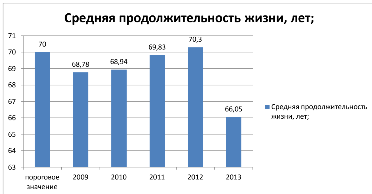
Динамика 3 – Динамика соотношения уровня средней продолжительности жизни, в соотношении с пороговым значением индикатора в 2009-2013 гг. [4]

По данным рисунка 3 можно отметить, что за исследуемый период фактическое значение индикатора лишь в 2012 г. соответствовало пороговому, а в остальных периодах было существенно ниже предельно допустимого уровня, стоит также отметить, и тот факт, что фактическое значение индикатора в 2013 г. является наиболее негативным: при пороговом значении в 70 лет, в 2013 г. фактическое значение составило 66,05 лет.