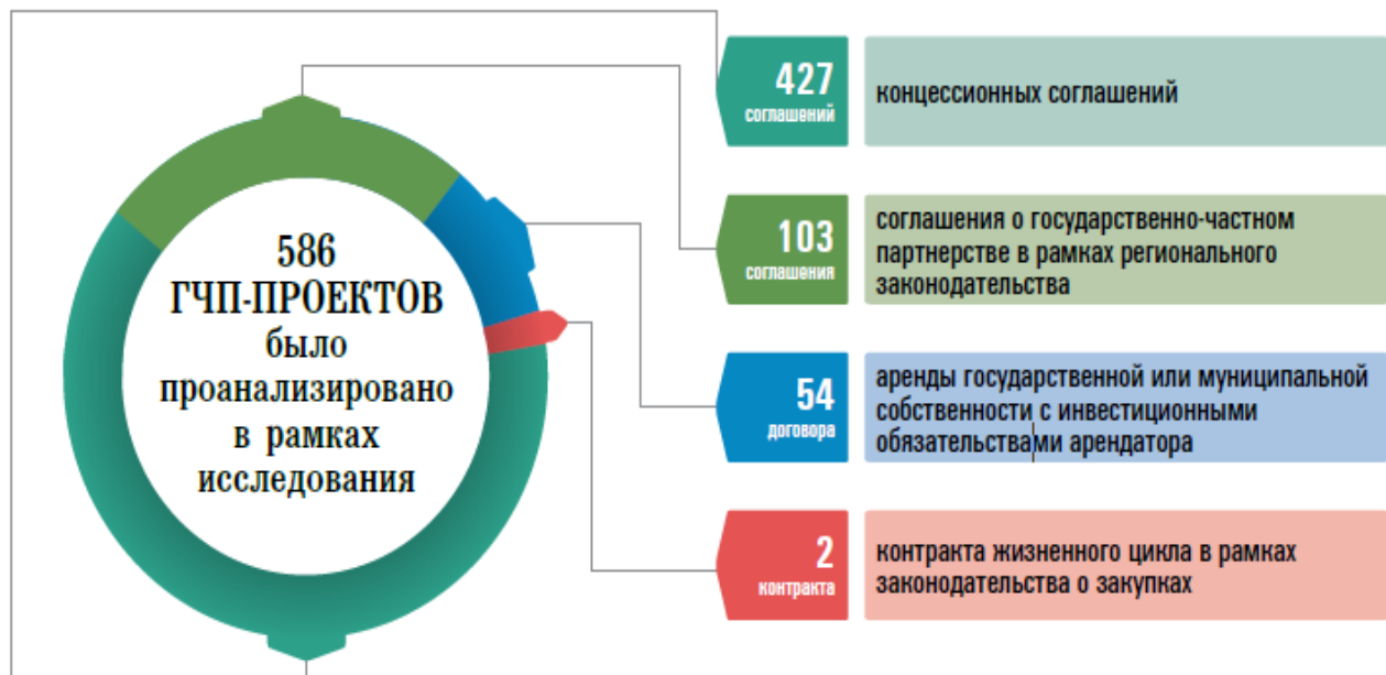
Рисунок 1 – Формы реализации ГЧП-проектов в РФ на региональном уровне, 2015 г.

Большинство ГЧП-проектов реализуется в Приволжском Федеральном Округе, хотя количество частных инвестиций в большем объеме приходится на ЦФО (102 325 366 тыс. рублей против 23 145 586 тыс. р. в ПФО) [10].