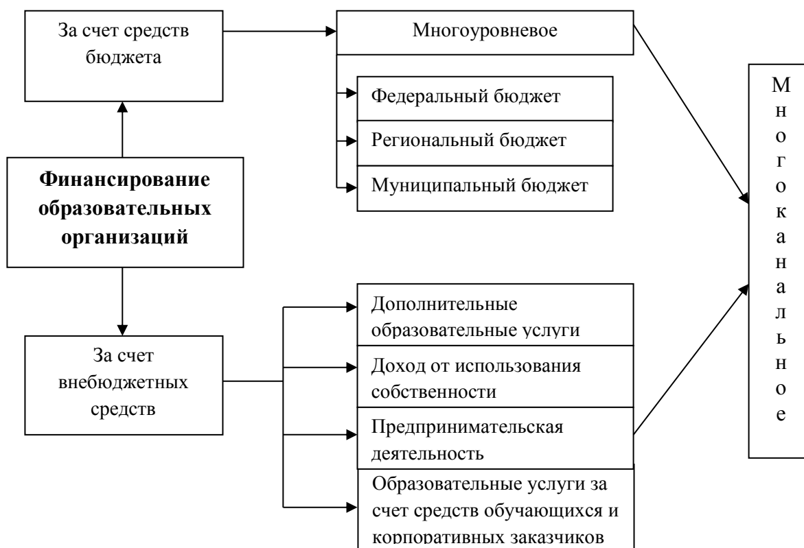
Рисунок 2 – Способы финансирования образовательных учреждений

Учредителями государственных образовательных учреждений являются или Правительство Российской Федерации в лице федерального органа управления образованием или орган исполнительной власти субъекта Российской Федерации потому и финансирование государственных образовательных учреждений осуществляется из средств бюджетов различных уровней, именно: федерального, бюджета субъекта РФ или местного бюджета. Способы финансирования образовательных организаций представлены на рисунке 2.