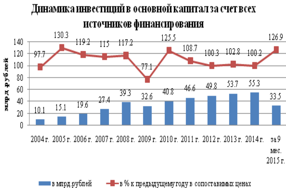
Рисунок 1 - Динамика инвестиций в основной капитал за счет всех источников финансирования

являются сельское хозяйство (2810,3 млн. руб.) и ЖКЖ в сфере производства и распределения электроэнергии, газа и воды. Таким образом, за анализируемый период инвестиции в Республике Мордовия в основной капитал показывали положительную динамику. Незначительное снижение инвестиционных поступлений в экономику Республики служит показателем ее не стабильного положения в глазах инвесторов. Проводимая инвестиционная политика способствовала только поддержанию сложившегося уровня инвестиций в основной капитал.