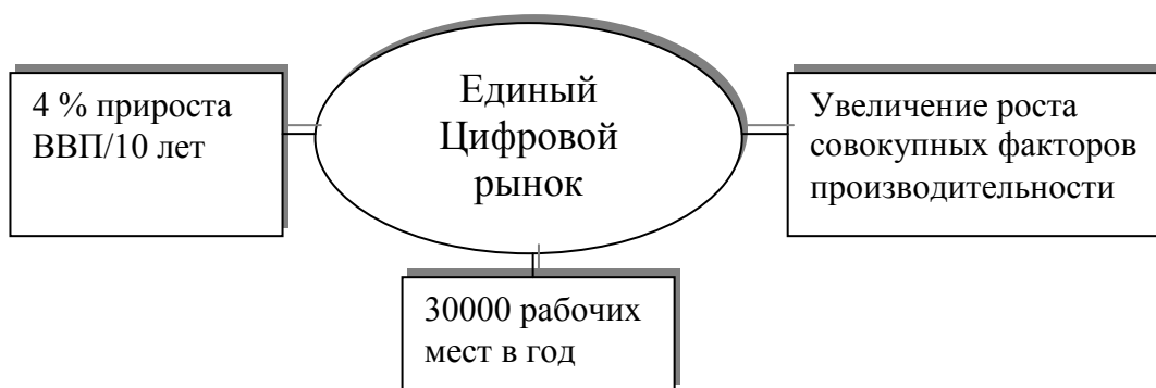
Рисунок 2 – Социально-экономические преимущества единого цифрового рынка ЕС

Единый цифровой рынок ЕС имеет ряд социально-экономических преимуществ перед национальными рынками (рис. 2).