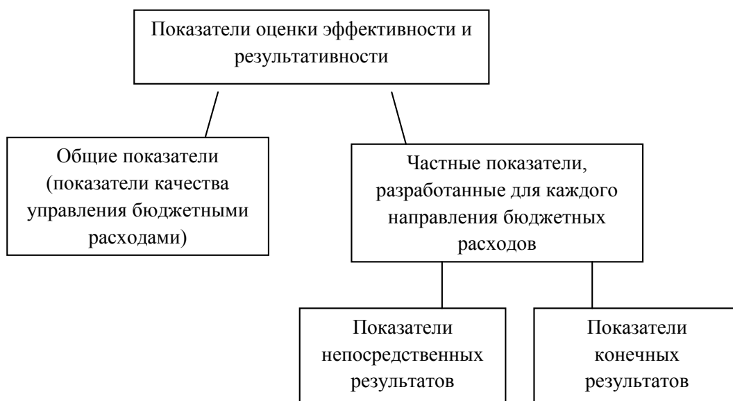
Рисунок 1 – Система показателей оценки эффективности и результативности бюджетных расходов

которые выражаются, по ниже представленному подходу, в социальных расходах. В системе показателей оценки эффективности и результативности можно выделить общие и частные (рисунок 1).