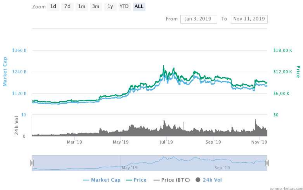
Рисунок 2 - Динамика Биткойна за 2019 [1].

На рисунке 2 представлены статистические данные по курсу Биткойна за 2019 год с сайта coinmarketcap.com . Во многих моментах динамика курса Биткойна коррелирует с курсом доллара США. Так, например, резкий рост цены Биткойна в июле как бы обозначает предстоящий аналогичный рост доллара США в августе-сентябре. На некоторых отрезках (октябрь-ноябрь) наблюдается обратная корреляция- Биткойн ступенчато растёт при том, как доллар падает аналогичным образом.