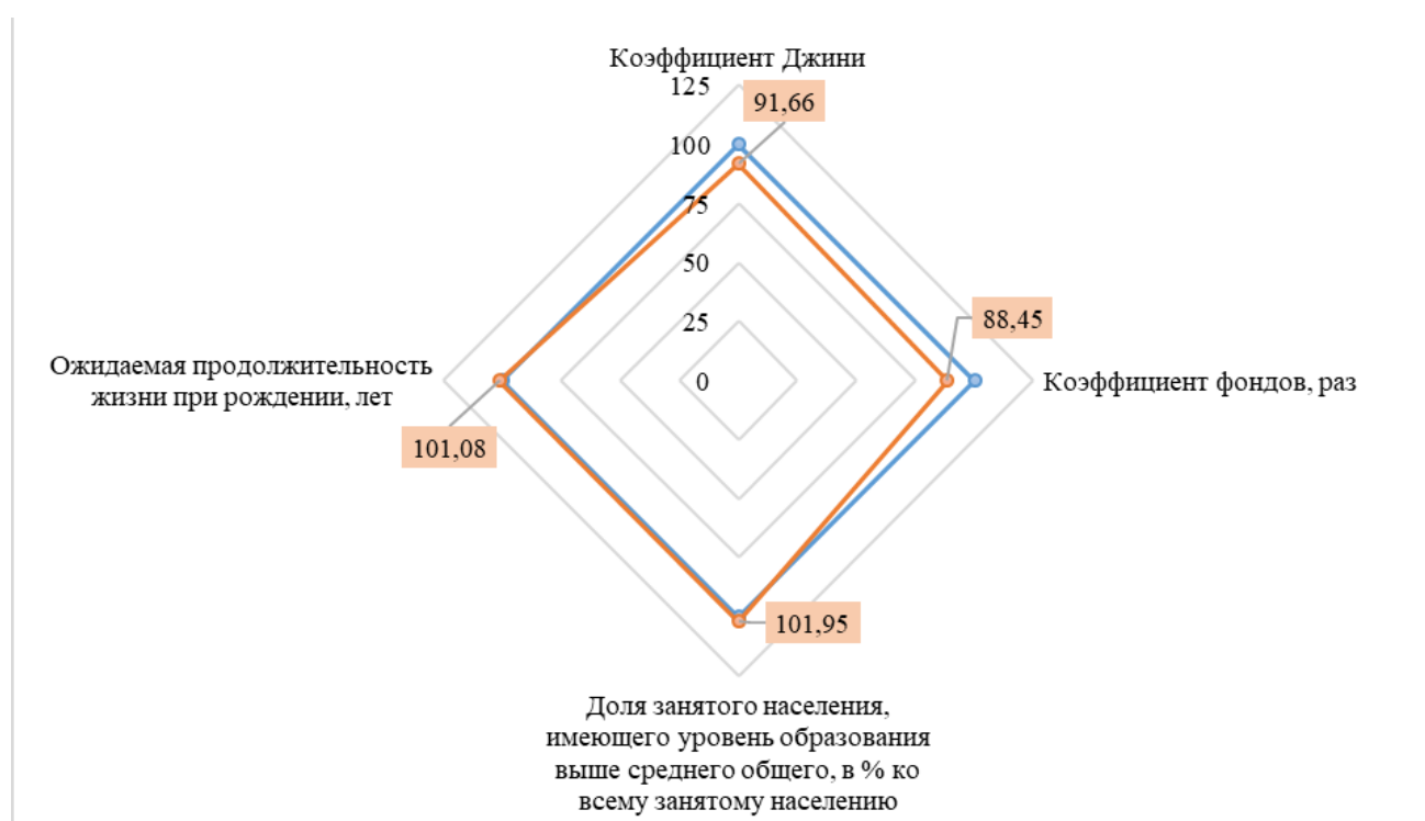
Рисунок 2 – Сравнение индикаторов человеческого потенциала Республики Мордовия в 2020 г. с их пороговыми значениями

Из рисунка видно, что такие индикаторы как: «Коэффициент Джини» и «Коэффициент фондов» попадают в зону «умеренного риска». Это значит, что они не представляет значительных угроз для экономической безопасности, но все равно данное положение индикаторов может привести к социальным проблемам в регионе. Коэффициент Джини дает возможность сравнить степень неравенства в распределении доходов в регионе. Превышение значения 0,3 говорит о том, что в регионе существует неравенство между доходами населения. Но в 2020 году мы видим незначительное превышение данного индикатора. Если говорить о коэффициенте фондов, то страна не должна допускать депопуляцию населения, а наоборот увеличивать долю среднего класса, заниматься воспроизводством социального потенциала, повышать качество жизни, трудового и человеческого потенциала. Это приведет к увеличению объемов и качества потребления различных группы населения, снижению дифференциации структуры расходов и доходов населения и, в конце концов, общество добьется социальной стабильности и справедливости.