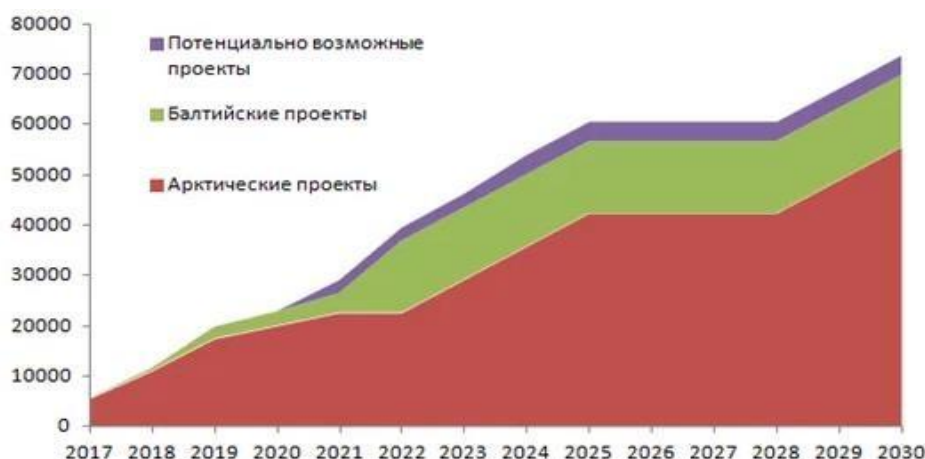
Рисунок 4 – Объем производства СПГ с возможностью поставки потребителям в Арктике, тыс. т.

Наличие огромных запасов углеводородов и выход к северным морям позволят развивать одно из важных направлений в газовой отрасли – производство сжиженного природного газа (далее – СПГ) (рисунок 4).