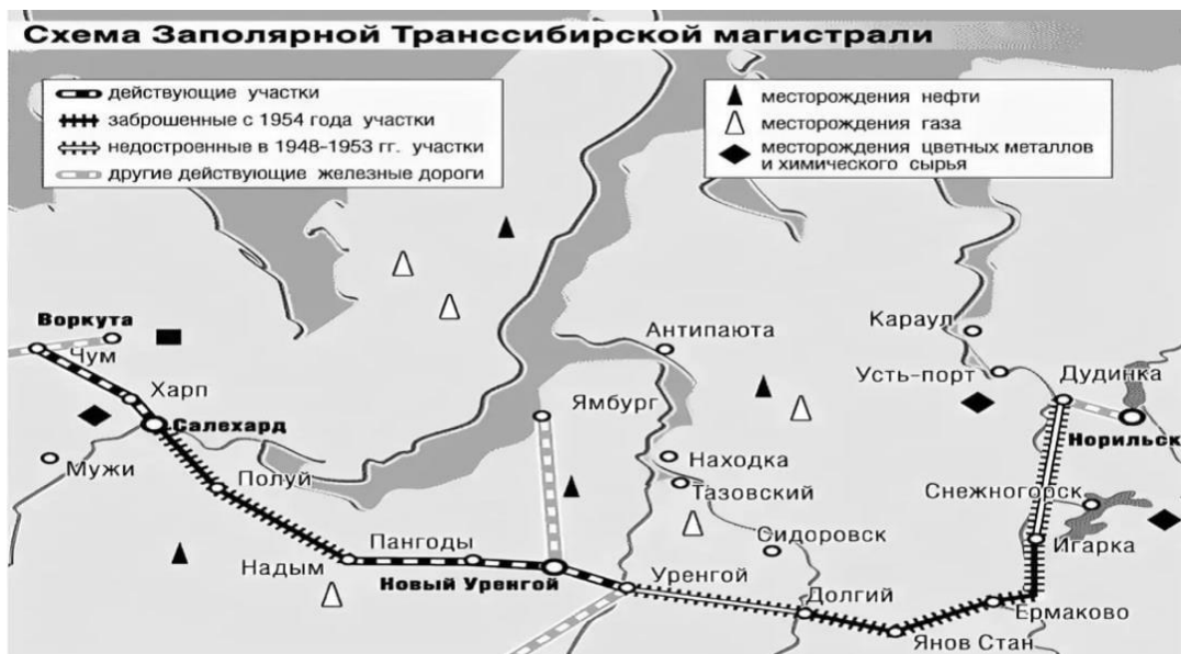
Рисунок 3 – Схема Северного широтного хода – Заполярной Транссибирской магистрали

Северный широтный маршрут будет способствовать формированию единой транспортной системы страны, что обеспечит круглогодичную доступность населенных пунктов Ямало-Ненецкого автономного округа [2].