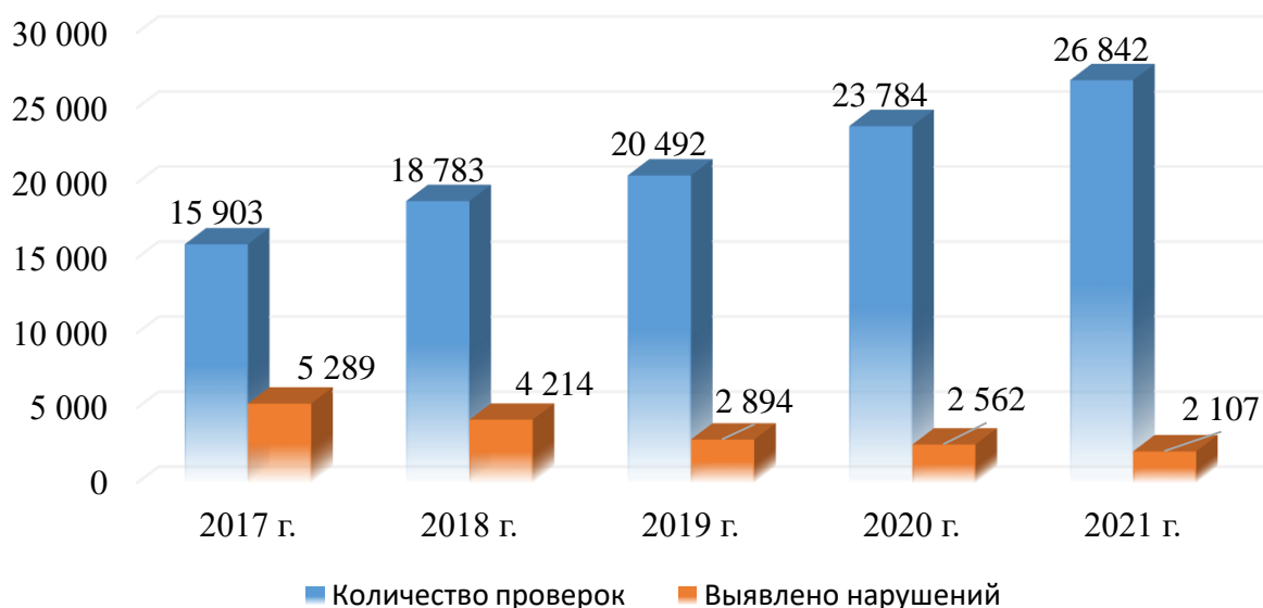
Рисунок 4 – Динамика количества проверок и выявленных нарушений ФНС РФ по Республике Мордовия по результатам налогового мониторинга за 2017-2021 гг., ед. [6]

Из рисунка 4 видно, что количество проверок в режиме прямого доступа выросло с 15 903 ед. в 2017 году до 26 842 ед. в 2021 году. При этом количество выявленных нарушений за исследуемый период систематически снижалось и достигло в 2021 году значения в 2 107 ед. Это показывает, что положительный результат от налогового мониторинга определенно есть.