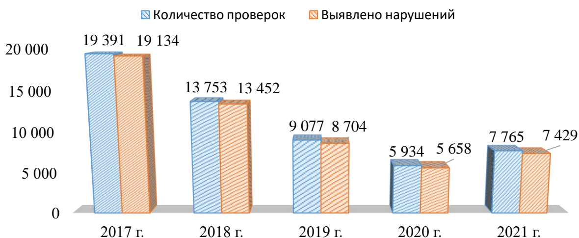
Рисунок 3 – Динамика количества выездных налоговых проверок и выявленных нарушений ФНС РФ по Республике Мордовия за 2017-2021 гг., ед. [6]

Следующей формой налогового контроля выступают выездные налоговые проверки (рисунок 3) [6].