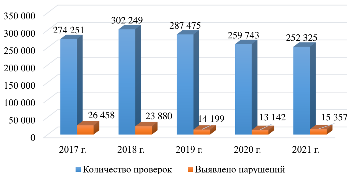
Рисунок 1 – Динамика количества проведенных камеральных налоговых проверок и выявленных нарушений ФНС РФ по Республике Мордовия за 2017-2021 гг., ед. [6]

Рассмотрим динамику проведения камеральных налоговых проверок ФНС РФ по Республике Мордовия за 2017-2021 гг. (рисунок 1) [6].