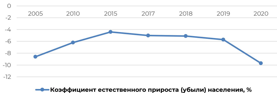
Рисунок 8 – Динамика коэффициента естественного прироста (убыли) населения, %

При таких тенденциях становится очевидной необходимость проведения государством активной экономической политики, направленной на решение социальных проблем в России, в том числе и развитие уровня жизни. Демографическую ситуацию ухудшает также и коэффициент естественного прироста населения Республики Мордовия, который имеет отрицательную тенденцию (Рисунок 8). Так, с 2005 по 2020 года можно наблюдать естественную убыль населения. Если после 2005 года в течение нескольких лет происходило ее сокращению, то к 2017 ситуация изменилась. Максимальная убыль приходится на 2020 год и составляет 9,7%, что также связано с пандемией коронавируса, которая повлекла за собой большой рост смертности.