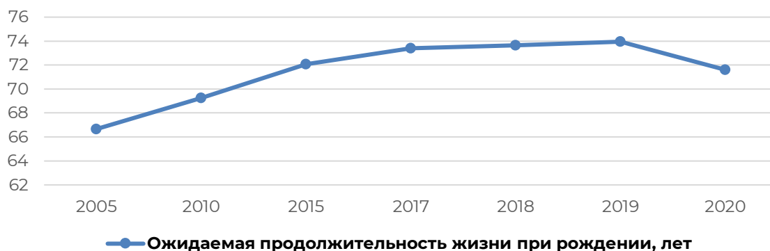
Рисунок 7 – Динамика ожидаемой продолжительности при рождении лет

Изучая заявленную проблематику, необходимо сказать об увеличении ожидаемой продолжительности жизни за рассматриваемый период (Рисунок 7).