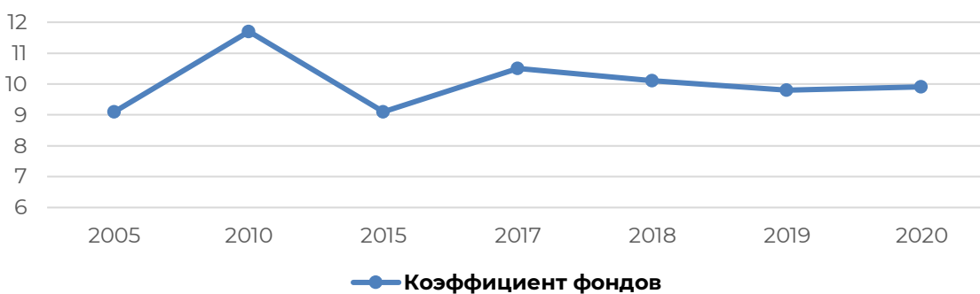
Рисунок 5 – Динамика коэффициента фондов, раз

Что касается показателя «Коэффициента фондов», его значение по РМ ниже, чем по РФ, чему свидетельствует тот факт, что преобладающая часть населения региона имеет довольно низкие денежные доходы, что говорит об отсутствии большой базы обеспеченных людей, способных увеличить разрыв в доходах. Динамика коэффициента фондов РМ представлена на рисунке 5.