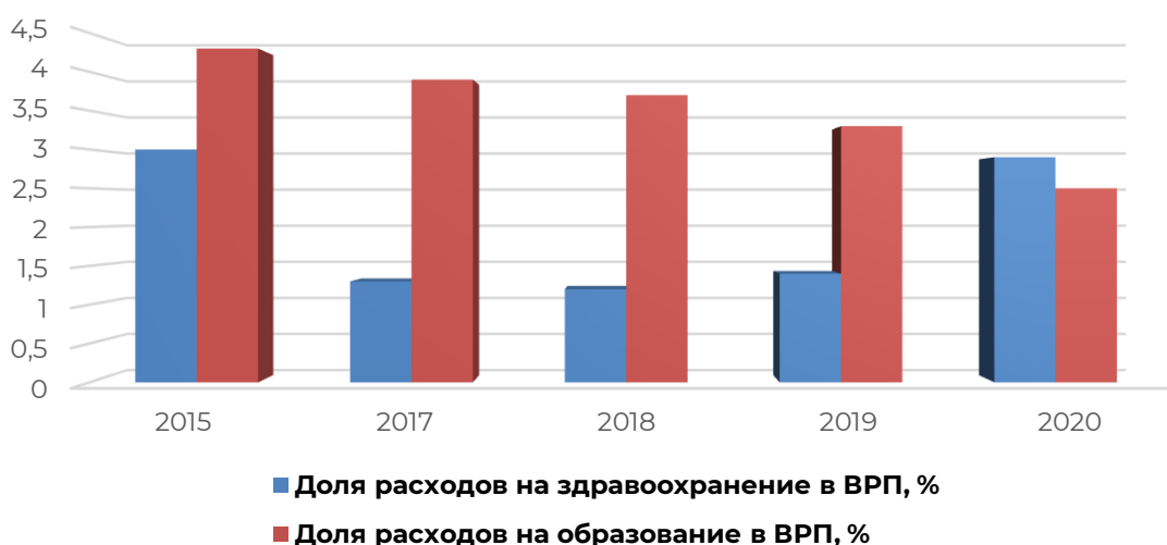
Рисунок 6 – Динамика доля расходов на здравоохранение и образование в ВРП, %

Так, происходит спад доли расходов на образование в ВРП Мордовии: спад составляет 1,8%, включая 2020 год. Тоже касается и отношения государственных расходов на здравоохранение к ВРП Мордовии с 2015 по 2019 года на 1,6% (Рисунок 6). Говоря о 2020 году, мы можем наблюдать увеличение этого отношения на 1,5%. Такое повышение расходов связано с начавшейся в 2020 году пандемией COVID-19, требовавшей колоссального количества средств на борьбу с ней. Но и данные значения показателей малы для создания высокого уровня жизни населения в регионе.