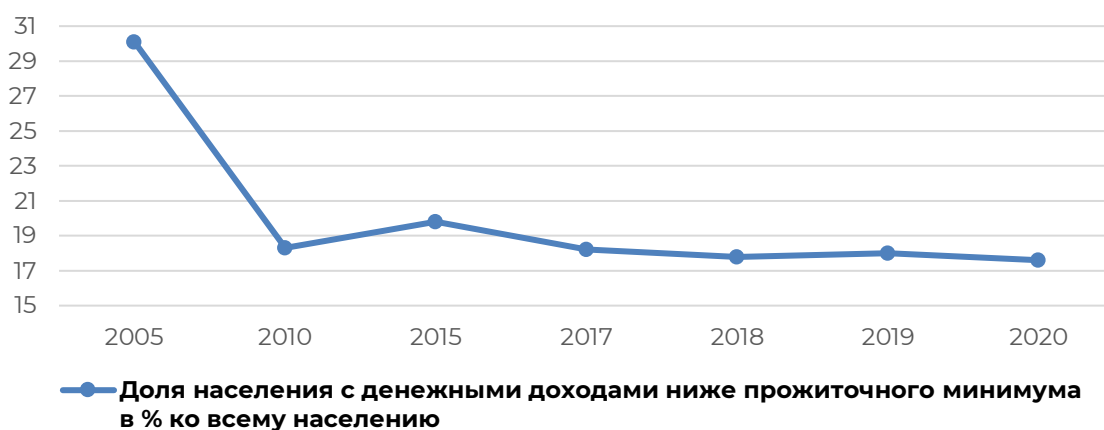
Рисунок 4 – Динамика доли населения с денежными доходами ниже прожиточного минимума РМ, в % ко всему населению

Увеличение значения и в РФ, и в РМ приходится на 2015 год и составляет 19,8% и 13,4% соответственно. Рост показателя во многом обусловлен сверхвысокими темпами потребительской инфляции в начале 2015 года, которые привели к увеличению стоимости прожиточного минимума более чем на четверть по сравнению 2014 годом.