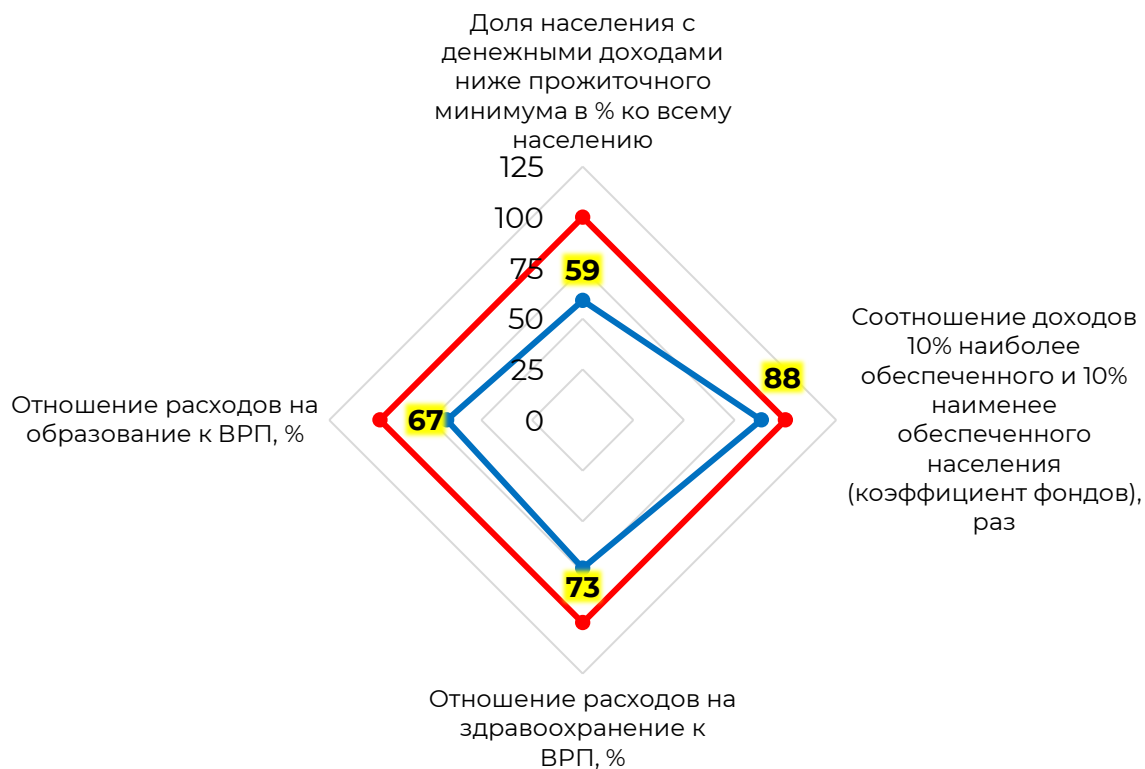
Рисунок 9 - Сравнение показателей экономической безопасности в социальной сфере за 2020 год с их пороговыми значениями

Для того, чтобы наглядно сравнить пороговые значения с показателями экономической безопасности в социальной сфере воспользуемся зонной теорией и построим лепестковую диаграмму (Рисунок 9).