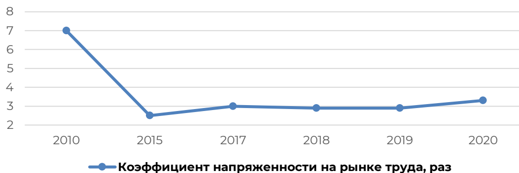
Рисунок 2 – Динамика коэффициента напряженности на рынке труда, раз

Исходя из таблицы, можно сделать вывод о снижении значений показателей. Основной причиной такого процесса стали вводимые по всему миру ограничения из-за вспышки коронавирусной инфекции. Так, за период 2010-2020 года произошел спад значений показателей «Коэффициента напряженности на рынке труда» с 7% до 3,3% (на 3,7%), что свидетельствует о росте дисбаланса спроса и предложения на рынке труда (Рисунок 2).