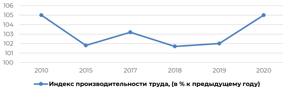
Рисунок 3 – Динамика индекса производительности труда, (в % к предыдущему году)

Что касается «Индекса производительности труда» (Рисунок 3), в 2010 и 2020 годах его значение тождественно и составляет 105%. Но с 2011 по 2019 года происходят как отрицательные, так и положительные изменения. Предполагаем, что причина в следующем: не происходит замещение труда капиталом, так как стоимость труда достаточно низкая из-за чего бизнесу выгоднее использовать ручной труд и платить низкую заработную плату, не вкладываясь в модернизацию и автоматизацию производства. Рост производительности труда можно обеспечить качественными трудовыми ресурсами и темпами модернизации, автоматизации и цифровизации экономики.