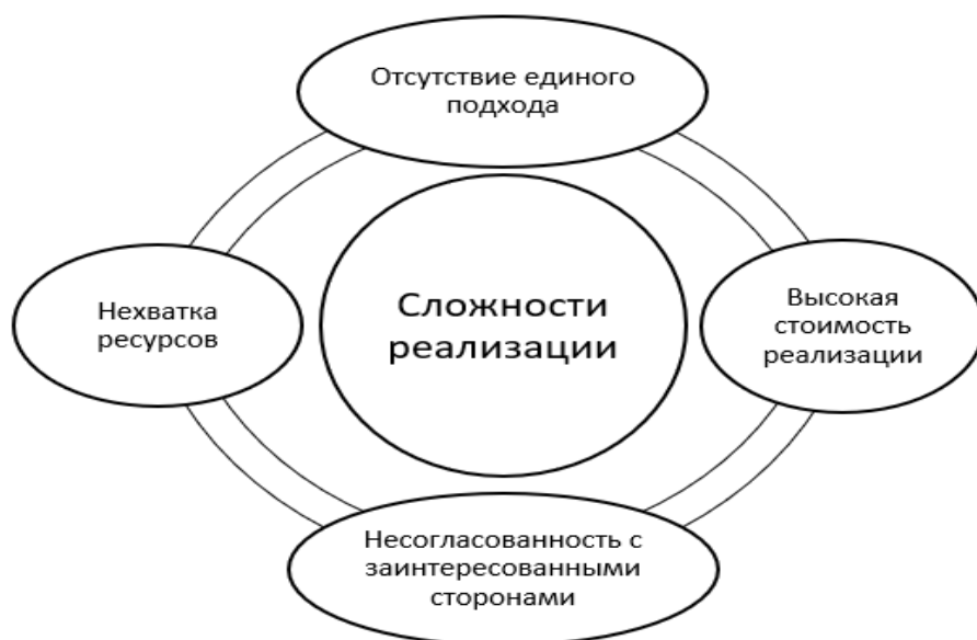
Рисунок 2 – Сложности интеграции принципов ESG в стратегии развития предприятия

Четвертым ограничением является объективная нехватка ресурсов для реализации принципов ESG. Некоторые организации не имеют знаний и опыта для инициации организационных изменений, и ESG-трансформации.