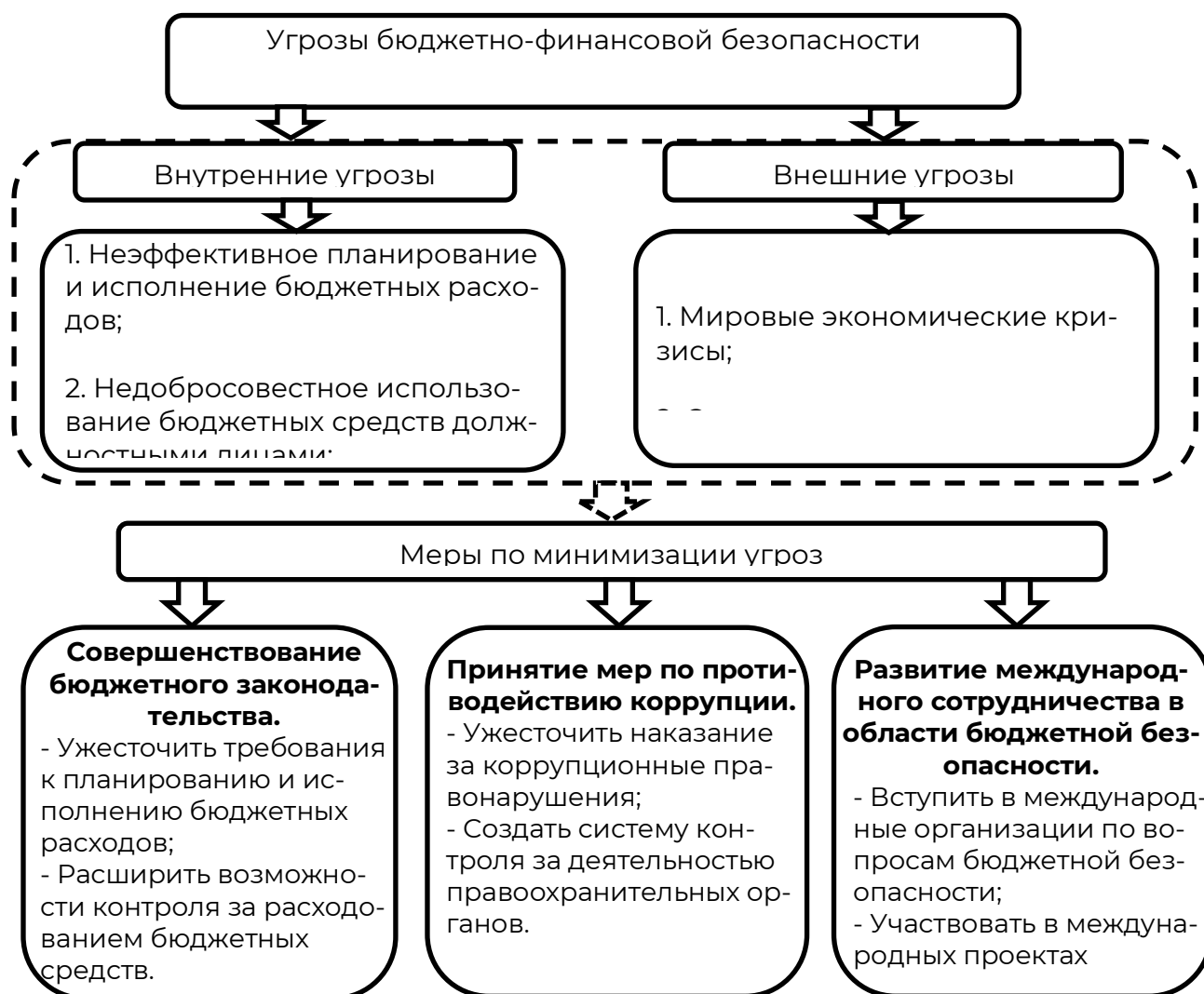
Рисунок 3 – Угрозы бюджетно-финансовой безопасности Республике Мордовия и меры по их минимизации

Внешний и внутренний контроль за бюджетом осуществляется только в рамках контроля целевого использования и расходования средств, но для нейтрализации выявленной угрозы неэффективности использования бюджетных средств, необходим контроль и анализ структуры направления бюджетных расходов. Планирование бюджета необходимо для направления средств в сферы, требующие финансирования для устойчивого развития в рамках национальных интересов.