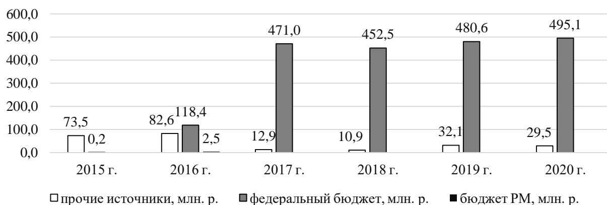
Рисунок 2 – Динамика поддержки малого и среднего предпринимательства в Республике Мордовия

На фоне отмеченных явлений финансовая поддержка малого и среднего предпринимательства имеет ключевое значение для продолжения деятельности. Однако, согласно имеющимся на Портале малого и среднего предпринимательства РМ данным, финансирование из бюджета региона было предоставлено лишь в 2016 г. и составило 2,5 млн.р. (рисунок 2).